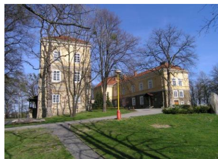
Budova školní družiny v zámeckém parku