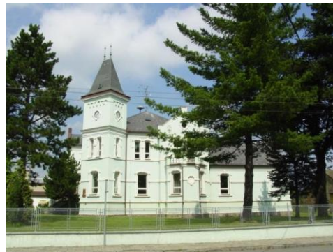
Budova ZŠ v Zábřehu