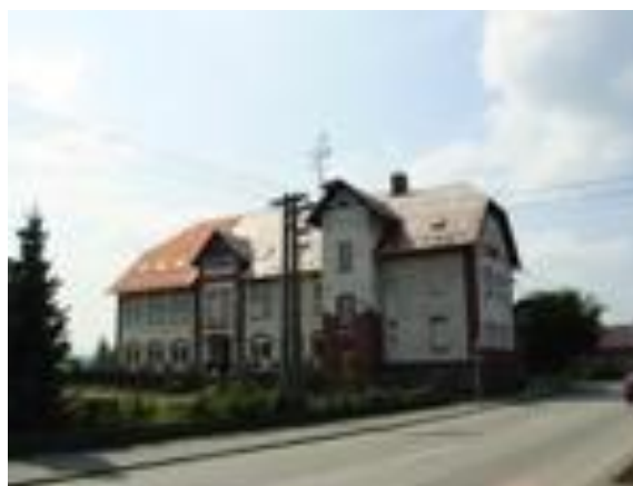
Budova „Červené školy“