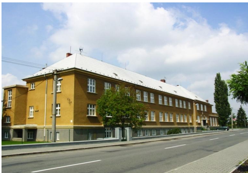
Budova „hlavní“ školy na ul. Nádražní