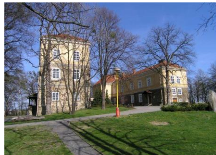
Budova školní družiny v zámeckém parku