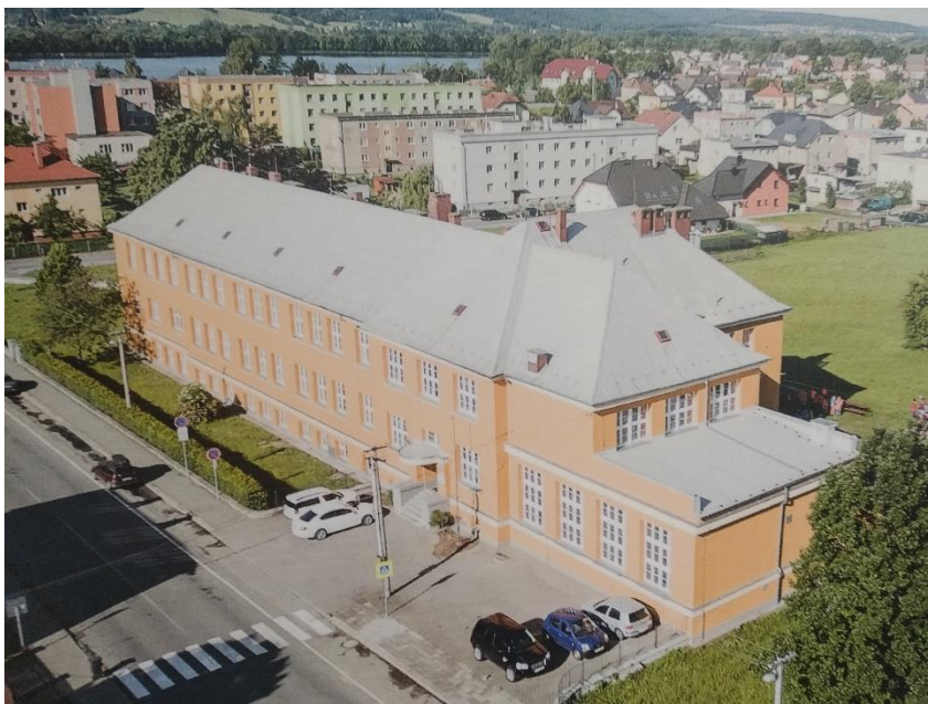
Budova „hlavní“ školy na ul. Nádražní