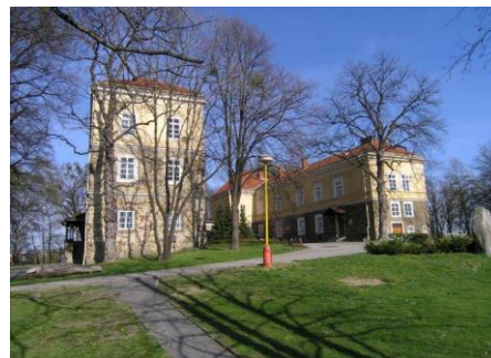
Budova školní družiny v zámeckém parku